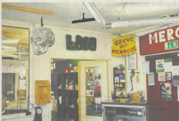
Inizio accueille des jeunes de 15 à 25 ans dans des locaux mêlant ateliers, espaces créatifs et lieux de calme. (VEVEY, 18 ET 19 MAI 2026)